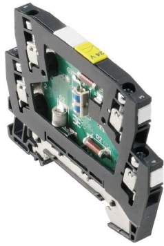
Come da figura