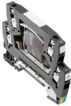
Come da figura