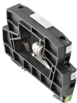
Come da figura