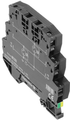
Come da figura