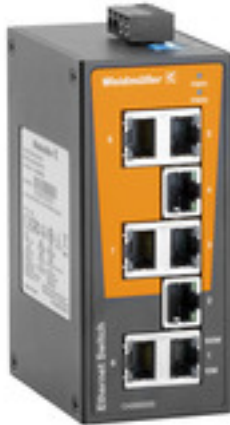
Illustrazione del prodotto