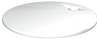
Come da figura