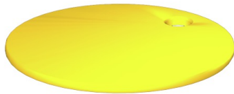
Come da figura