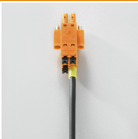
Large connection cross-section Up to 1.5 mm possible with ease