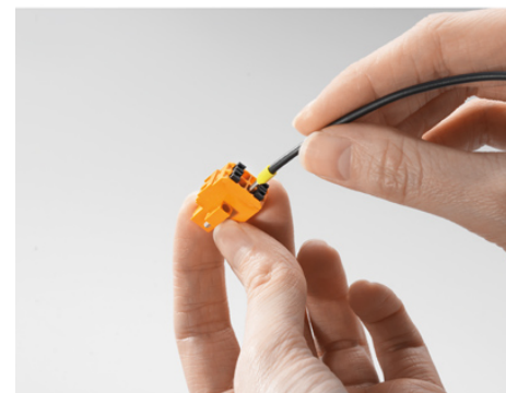
Fast PUSH IN connection Tool-free and touch-safe