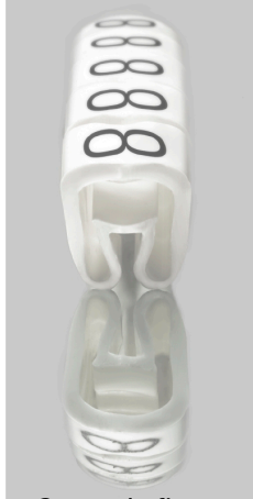
Come da figura