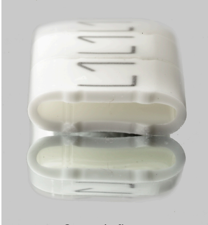
Come da figura