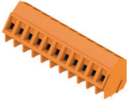
Illustrazione del prodotto