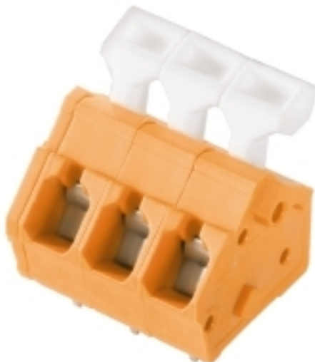
Illustrazione del prodotto