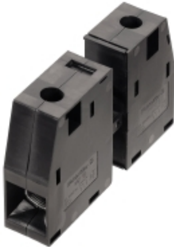
Illustrazione del prodotto