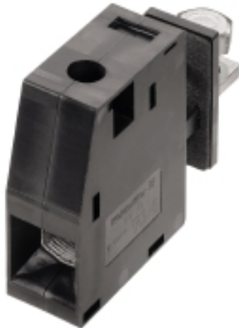
Illustrazione del prodotto