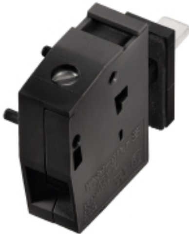
Illustrazione del prodotto