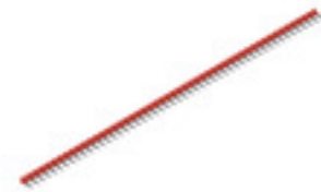
Illustrazione del prodotto