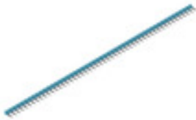
Illustrazione del prodotto