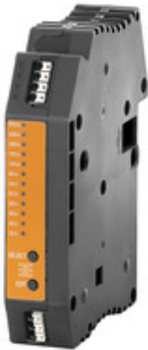
Illustrazione del prodotto