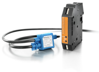
use with Rogowski coil